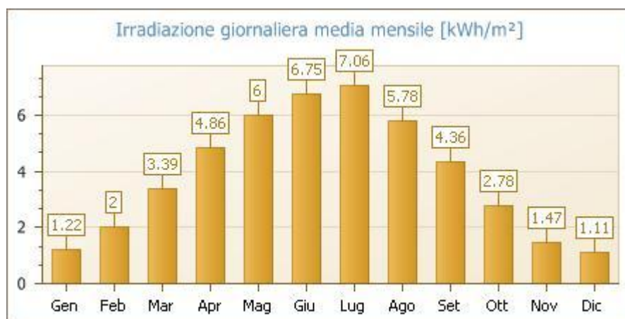
Fig. 1: Irradiazione giornaliera media mensile sul piano orizzontale [kWh/m 2 ]- Fonte dati: UNI 10349 - Località di riferimento: REGGIO NELL'EMILIA (RE)/MODENA (MO)

Fonte dati: UNI 10349 - Località di riferimento: REGGIO NELL'EMILIA (RE)/MODENA (MO)