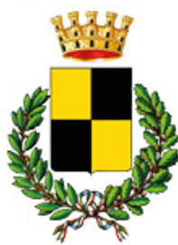
Comune di Novellara