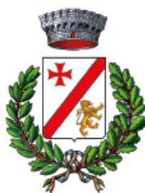
Comune di Boretto