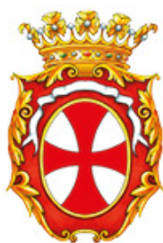
Comune di Reggiolo